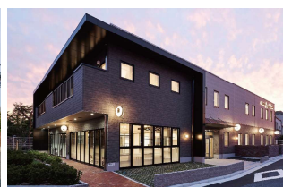
あとりえらぼ遊育園