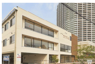
みなみせんりおか遊育園