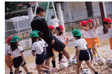
体育・サッカー教室（課内）