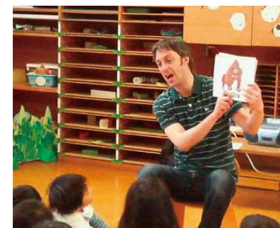
英語あそび（課内・課外）

外国人との交流体験は、グローバルな世界へと 園児が目向ける機会づくりと考えています。